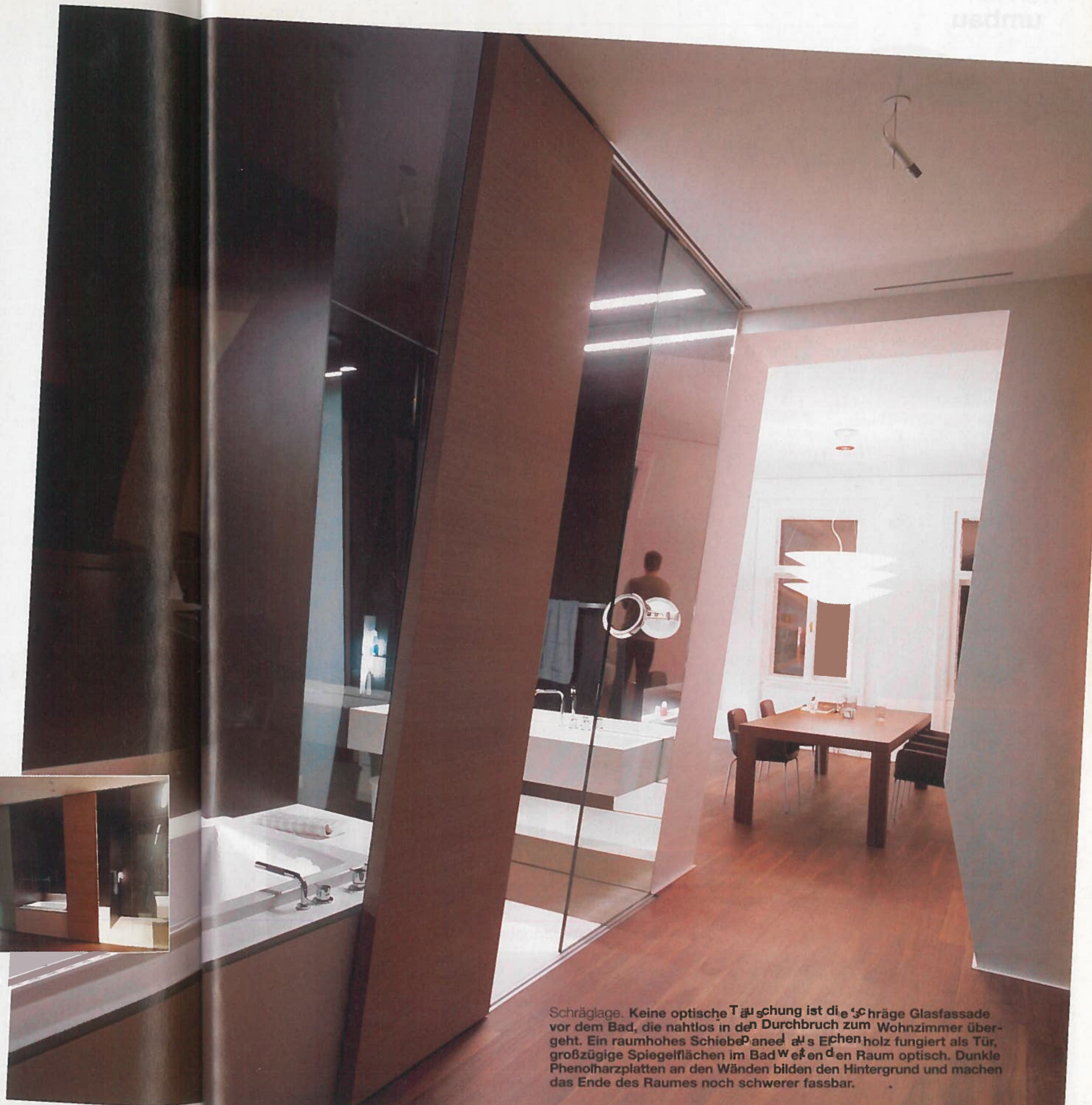
Schräglage. Keine optische Täuschung ist die schräge Glasfassade vor dem Bad, die nahtlos in den Durchbruch zum Wohnzimmer übergeht. Ein raumhohes Schiebepaneel aus Eichenholz fungiert als Tür, großzügige Spiegelflächen im Bad weiten den Raum optisch. Dunkle Phenolharzplatten an den Wänden bilden den Hintergrund und machen das Ende des Raumes noch schwerer fassbar.