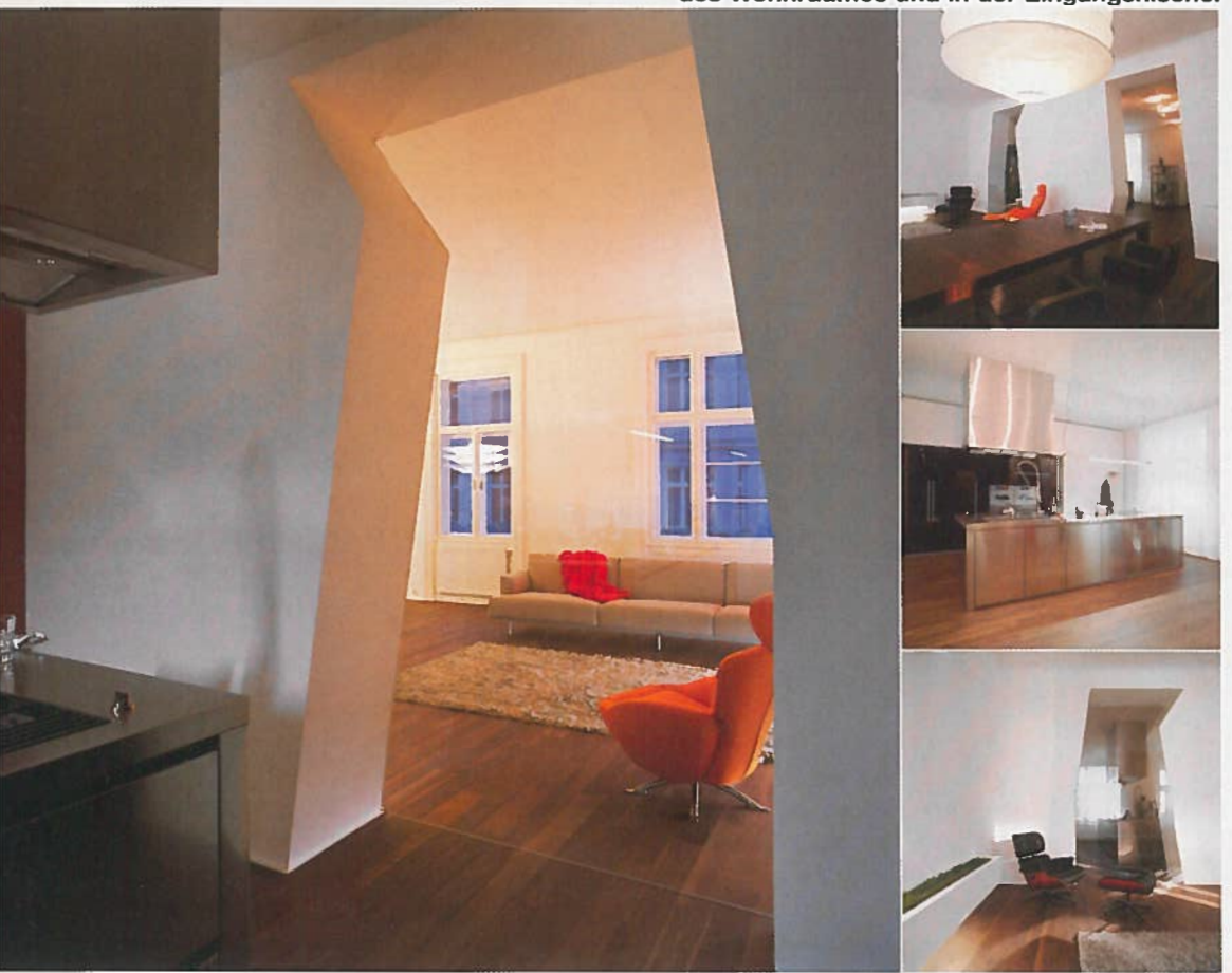
Einschnitt. Die drei frei geformten Durchbrüche – zwei davon zum Durchschreiten, einer jedoch fix verglast – in der Kaminmauer zwischen Küche und Wohnraum erlauben nicht nur interessante Durch-Blicke, ihre Form wiederholt sich auch in den Regalen des Wohnraumes und in der Eingangsnische.